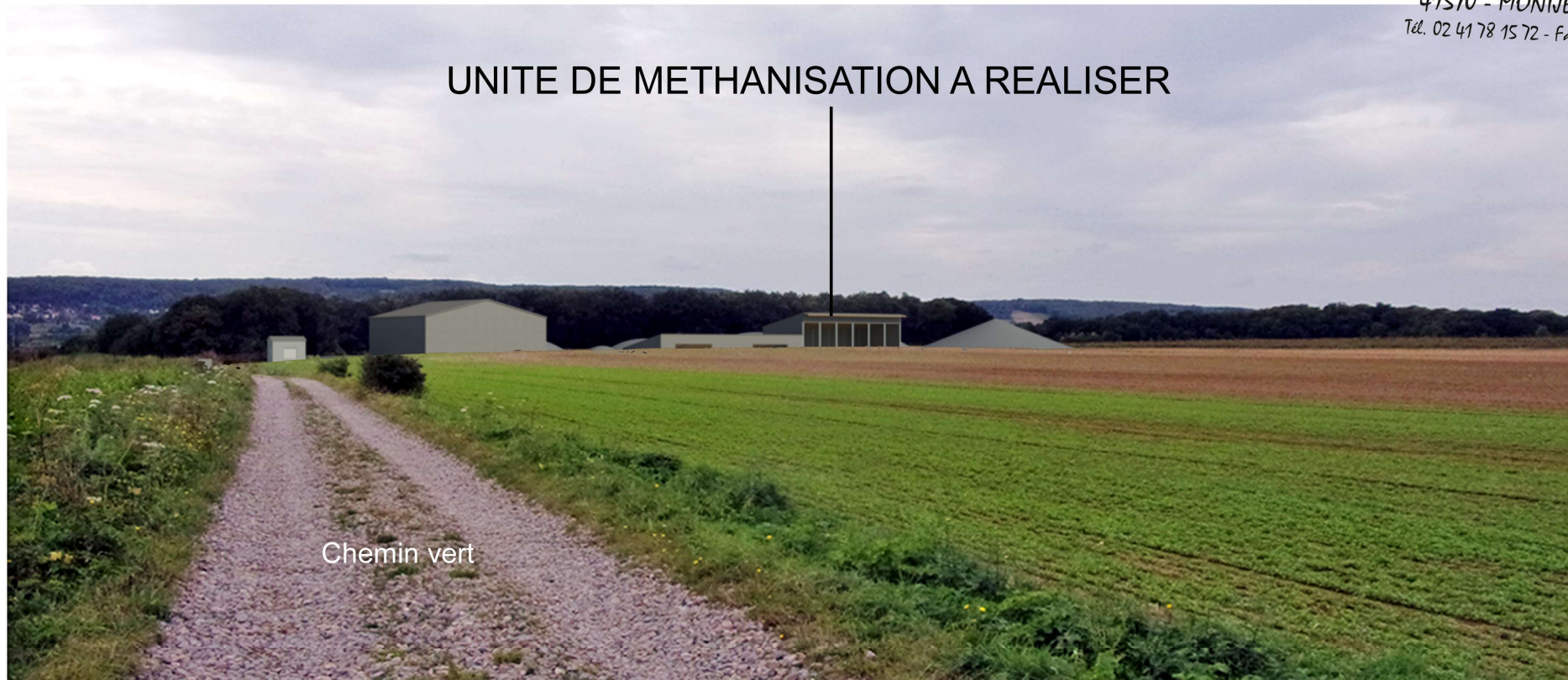
VUE EN PERSPECTIVE, SIMULATION APRES TRAVAUX