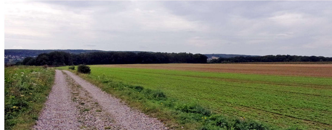
INSERTION DE L'OUVRAGE DANS LE PAYSAGE, IMPACT VISUEL

Jean-François RETHORE ARCHITECTE D.P.L.G. 16 Ter Chemin des Vendangeurs 49570 - MONTJEAN S/LOIRE Tél. 02 41 78 15 72 - Fax. 02 41 22 96 61