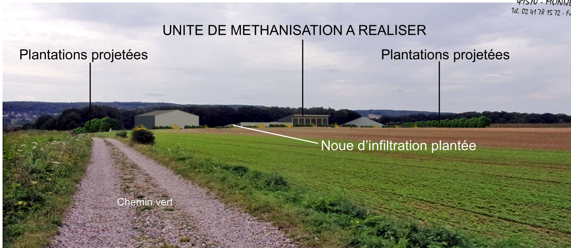
VUE EN PERSPECTIVE, SIMULATION APRES TRAVAUX ET APRES PLANTATIONS

Jean-François RETHORE ARCHITECTE D.P.L.G. 16 Ter Chemin des Vendangeurs 49570 - MONTJEAN S/LOIRE Tél. 02 41 78 15 72 - Fax. 02 41 22 96 61